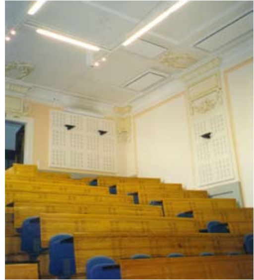
Расположение приборов на потолке – лучшая защита от несанкционированных контактов.