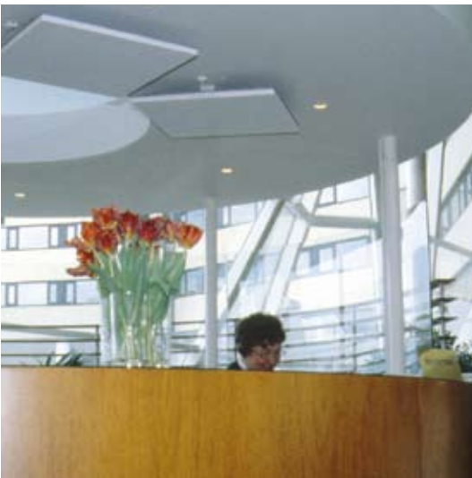
Локально добавить тепла в рабочую зону удобно с помощью потолочных кассет.