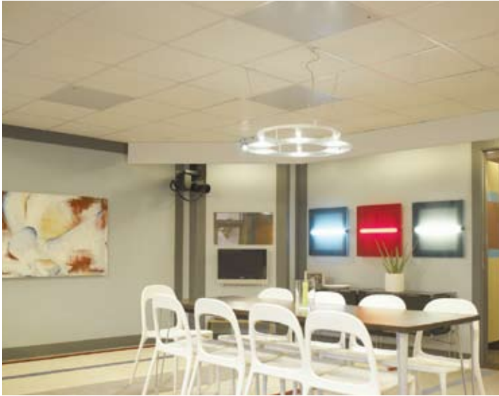
Потолочные кассеты обогревают помещение оставаясь практически незаметны. При необходимости их расположение легко изменяется.