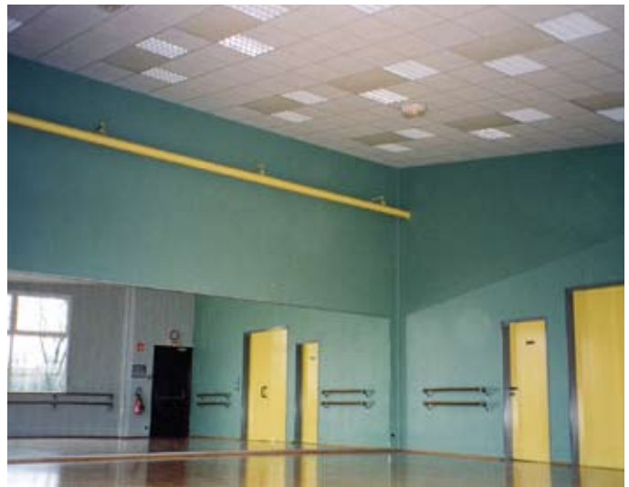
Инфракрасные обогреватели нагревают в первую очередь пол и другие предметы, поэтому им отдают предпочтение в тех случаях, когда люди могут находиться в помещении без обуви.