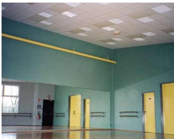
Инфракрасные обогреватели нагревают в первую очередь пол и другие предметы, поэтому им отдают предпочтение в тех случаях, когда люди могут находиться в помещении без обуви.