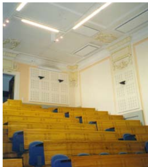
Расположение приборов на потолке – лучшая защита от несанкционированных контактов.